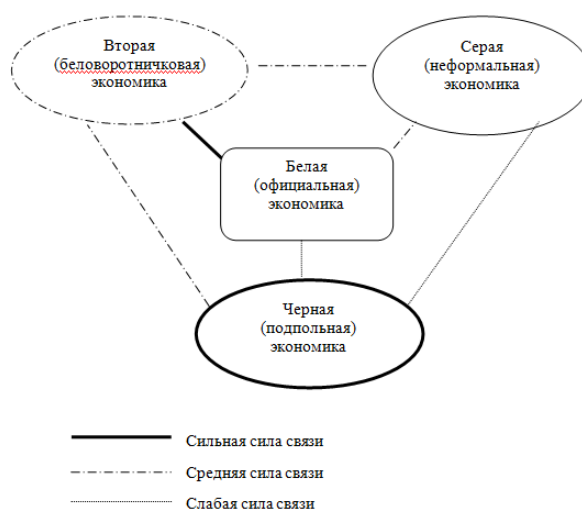
Рисунок 1 – Структура экономики с учетом теневых секторов

Черная теневая экономика – это запрещенная законом (нелегальная) экономическая деятельность, связанная с производством и реализацией запрещенных и остродефицитных товаров и услуг