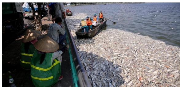
Рисунок 2 – Свыше 10 тонн рыбы погибло в Западном озере г. Ханоя [3]

вызывает уменьшение проточности, особенно на урбанизированных территориях. Для эффективной работы системы аэрации необходима ее комбинация с системой искусственного водооборота [5].