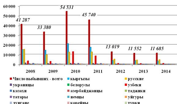
Рисунок 1 – Внешняя миграция населения (этнические показатели на 2008–2014 гг.) [2, с. 23]

Рисунок 1 демонстрирует пик высокой миграционной активности в 2010 г., когда из страны выехало 54 тыс. человек, этнический состав которых был представлен кыргызами, русскими и узбеками. Миграция русского и русскоязычного этносов обозначила тенденции к моноэтническому и моноконфессиональному составу населения.