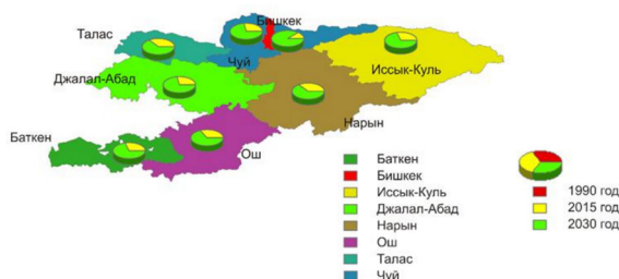
Рисунок 1 – Динамика и прогноз численности мечетей в Кыргызстане