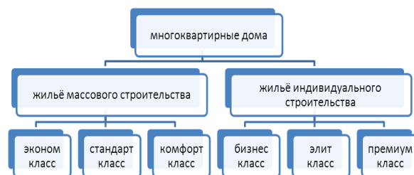
Рисунок 2 – Структура типизации многоквартирных домов по потребительскому качеству

В итоге получаем шесть классов многоквартирных домов. Каждый класс наделяется определенными характеристиками, обязательными для отражения в технических паспортах жилых объ-