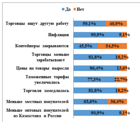
Рисунок 2 – Факторы, оказывающие наибольшее влияние на тревожность торговцев рынка «Дордой»

Для того чтобы выяснить, какие факторы вызывают чувство опасения и тревоги, были предложены следующие варианты. Результаты опроса 150 респондентов представлены на рисунке 2.