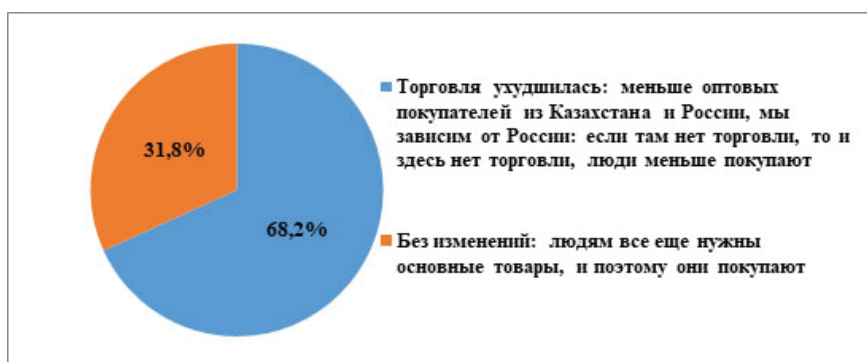
Рисунок 4 – Влияние мирового экономического кризиса на торговлю

торговли, торговцы считают инфляцию и резкое сокращение оптовых покупателей из Казахстана и России – по 90,9 % (136 человек). Не менее важными факторами торговцы считают повышение цены на товары – 86,4 % (130 человек) и увеличение таможенных тарифов – 77,3 % (116 человек).