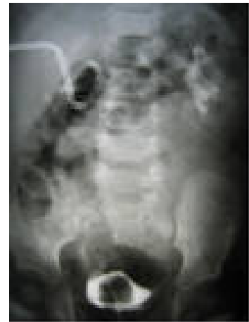
Рисунок 3 – Пункционная нефростомия почки

рации паренхимы почки, снижая тем самым риск развития рубцовых изменений вокруг дренажа и катетероассоциированных инфекций, не влияет на трудоспособность и социальную дезадаптацию больного. Однако при установке стент-катетра имеются свои отрицательные стороны в плане цистоскопического его удаления с возможностью реинфекции и травматизации слизистой уретры, а также необходимостью установки в раннем послеоперационном периоде уретрального катетера с целью предупреждения пузырно-почечных рефлюксов [5].