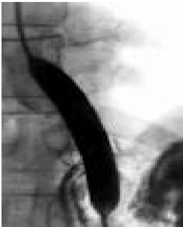
Рисунок 1 – Баллонная дилатация при стриктуре мочеточника