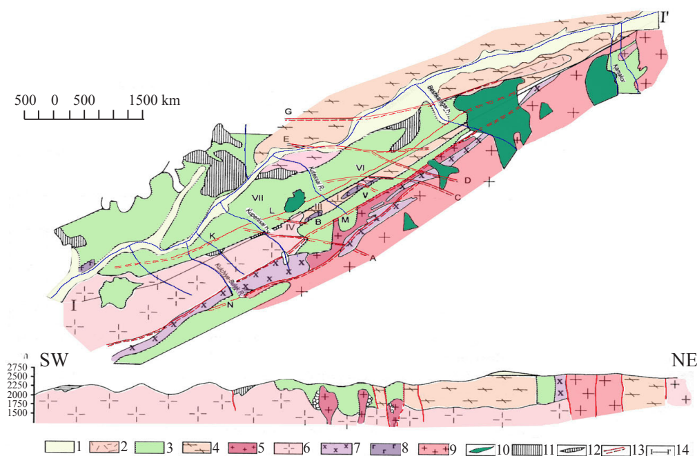
Рисунок 1 – Геологическая карта Актюзского рудного поля. Составили: Ким В.Ф. и др. 2001 г.