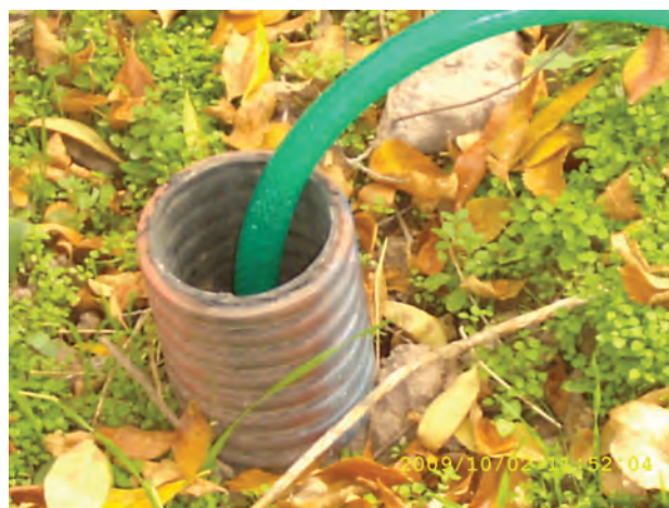
Рисунок 4 – Колодец гидранта с поливочным шлангом