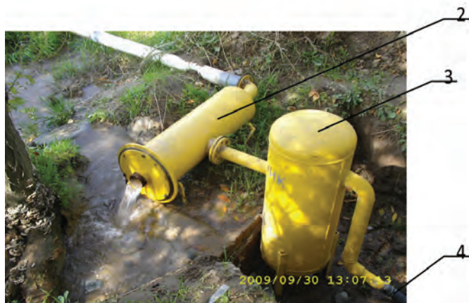
Рисунок 3 – Фильтр и гидроциклонный отстойник