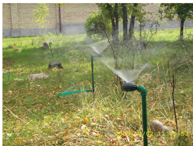
Рисунок 5 – Участок орошения методом дождевания с дождевальными насадками