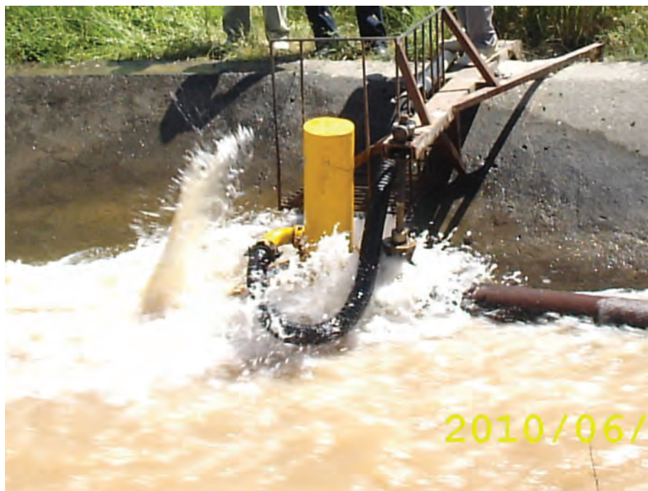
Рисунок 1 – Модернизированная насосная установка “Гидротаран” на канале-быстроходе

На расстоянии 50 м от фильтра 2 в северном направлении от магистрального трубопровода 4 отходит транзитный трубопровод 6 диаметром 32 мм, общей длиной 90 м. У северного угла учебного корпуса №12 установлен распределительный колодец (К) с краном (Кр) и штуцером. От этого колодца на расстоянии 15 м устроен аналогичный колодец для орошения газонов методом дождевания, расположенных между учебными корпусами № 12 и 13.