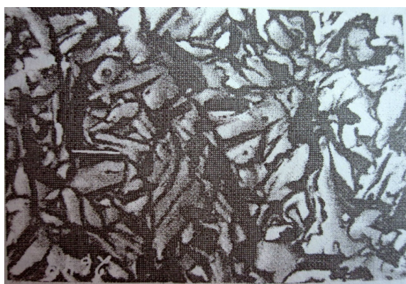
Рисунок 3 – Микроструктура фарфорового камня, обожженного при температуре 1410 °С. Фотография электронная. Увеличение 9000х

Температура обжига 1350 и 1410 °С (рисунок 3). Образцы похожи по структуре. Кристаллические зоны представлены кварцем и муллитом. Очертания зерен кварца округлые, зона оплавления увеличивается до 4–6 мкм. Отмечается рост кристаллов муллита в пределах псевдоморфоз по мусковиту. Кристаллы муллита короткопризматические, часто имеют округлую или почти квадратную форму. Наблюдаются двойниковые кристаллы, как бы разделенные пополам. Размер кристаллов муллита – 0,5–1 мкм.