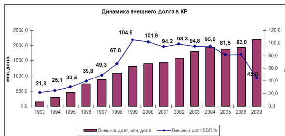
Рис. 2. Динамика внешнего долга КР 2 .

↳ обслуживание государственного долга. В последние годы проблема внешнего долга стоит весьма остро (рис. 2). Причиной этому является не только его нецелевое использование, но и недостаточное внимание к проблеме его образования в прошлом. В долгосрочной перспективе обслуживание государственного долга и бюджетный дефицит могут дестабилизировать макроэкономическую ситуацию, что может серьезно ограничить инструментальную независимость в поддержании курса валют, а это окажет негативное влияние на стабильность цен в стране.