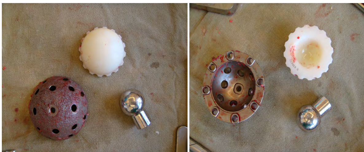
Рис. 3, 4. Интраоперационные рисунки пациентки Ш. Удаленный ацетабулярный компонент, головка и полиэтиленовый вкладыш

остеопластического костного трансплантата. В дальнейшем при исследовании через 6 мес. отмечали снижение накопления РФП в данной зоне, к первому году с момента операции накопление РФП в зоне операции было равно таковому в неоперированном суставе. Производилась оценка функционального результата по шкале Харриса через 6, 12, 24, 36 и 48 мес. после операции.