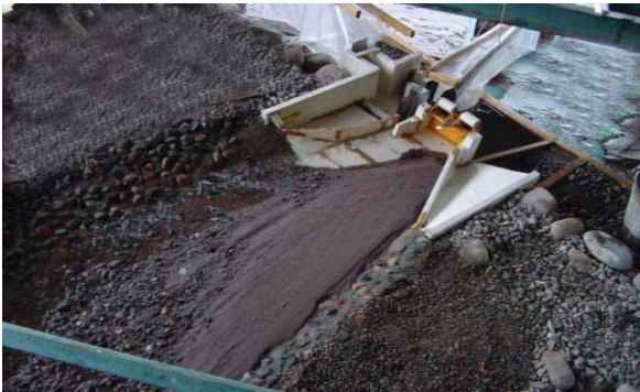
Рис. 3. Физическая модель водозаборного сооружения и криволинейного подводного русла после промывки верхнего бьефа паводковыми расходами.

Это также подтверждает фотография, на которой представлен рельеф дна криволинейного зарегулированного русла, выполненного без сужения в концевой части, на физической модели водозаборного сооружения после проведения промывки верхнего бьефа паводковыми расходами (рис. 3). На рисунке видно, что у выпуклого берега остается значительный объем мелких фракций частиц песка, которые ранее составляли призму наносов, сформированную при меженных расходах моделируемого потока. Физическое моделирование проводилось по общепринятой методике при Fg=idem без искажения масштаба. Масштаб модели водозаборного сооружения с подводным зарегулированным руслом был принят 1:25. Величина меженного расхода модели составляла Q_{75\%} = 1,25 \text{ л}^3/\text{с} , а паводкового расхода Q_{1\%} = 19,8 \text{ л}^3/\text{с} .