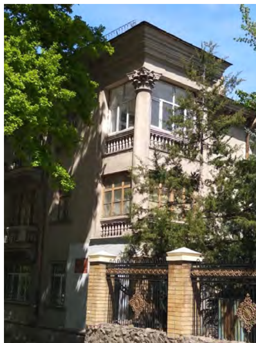
Рисунок 1 – Жилой дом на проспекте Эркиндик