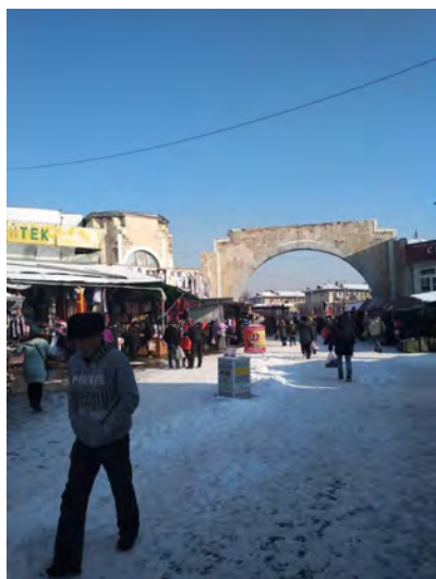
Рисунок 3 – Аламединский рынок