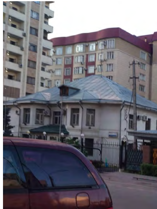
Рисунок 2 – Пример застройки городских улиц

Достоинство этих объектов состояло в том, что в них было продумано функциональное