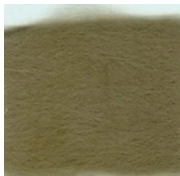
Базальтовый волокнистый утеплитель