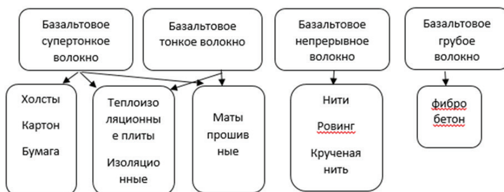
Рисунок 2 – Разновидность базальтовых волокон и изделий из них

Известно, что в восточной медицине в качестве одного из способов лечения издревле использовалась стоун-терапия, которая позволяет укрепить иммунитет и успокоить нервную систему человека. Это, как правило, сводилось к применению базальтового камня, который долго сохраняет тепло и максимально долго оказывает лечебное воздействие на организм. Поэтому было предложено использовать базальтовое волокно и в специальной обуви. Такие процедуры укрепляют сосуды, снимают усталость, стресс, мышечную и суставную боль, спазмы.