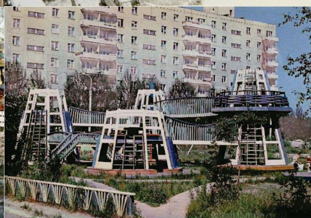
Рисунок 4 – Дворовые территории микрорайонов города Тобольска, конец 1970 – начало 1980 гг. [7, 8]