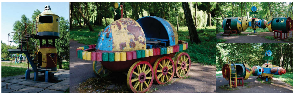
Рисунок 2 – Парк Топильче, город Тернополь [3]

с включением зон для активных игр, что создавало возможность развивать фантазию у детей и создавать свои правила игры. Несмотря на минимизированные конструкции игровых элементов площадок, они позволяли играть на этих территориях детям всех возрастов, предлагая самим подстраиваться под свои возможности [4].