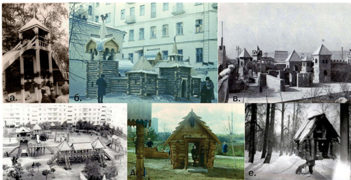
Рисунок 1 – Детский городок в Измайловском парке, 1962–1963 гг. (а, б); Детский городок «Сказка» в Протвино, 1974 г. (в); Городок в Перми на улице Мира, в районе ипподрома (г); Площадка в столичном парке Горького (д); Мурманск, детский городок у Семёновского озера (е) [2]

Наряду с этими комплексами, развивались и дворовые детские игровые площадки. В городах Советского Союза активно воздвигались жилые микрорайоны, в которых обустривались придомовые территории, сооружались детские площадки, площадь которых позволяла выделять отдельные участки для детей младшего возраста (песочницы, качели), а также и для детей постарше (турники, шведская стенка, горки). Чаще всего игровое оборудование имело общие стандартные решения, но при этом планировка дворовых территорий позволяла включать ассиметричные композиционные решения,