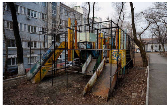
Рисунок 3 – Детские дворовые площадки и игровые комплексы 1970–1980 гг. [5]