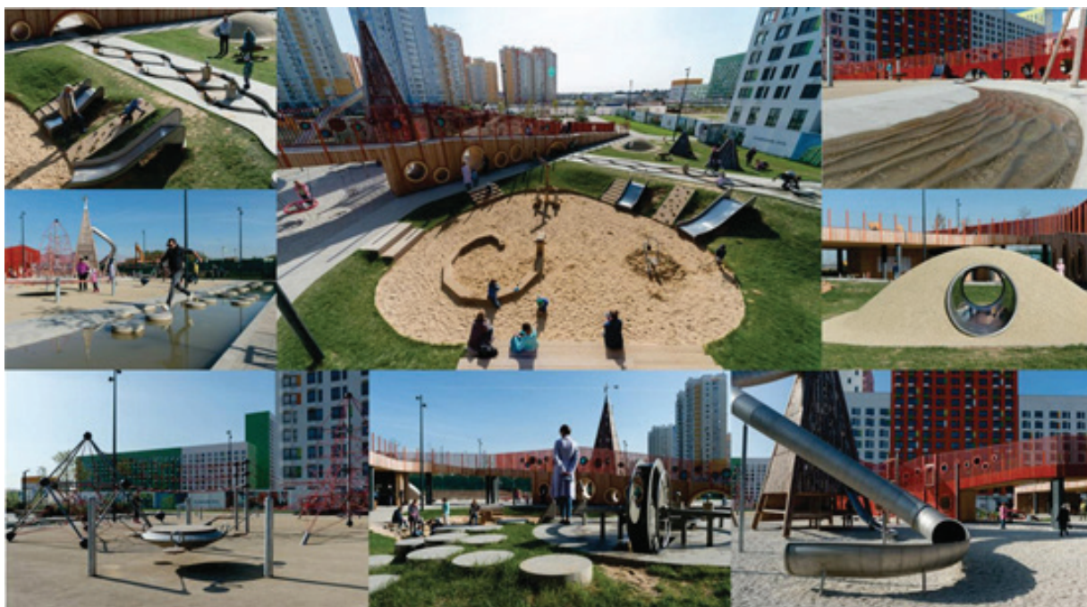
Рисунок 1 – Детская игровая площадка «Пирамиды», г. Москва [8]