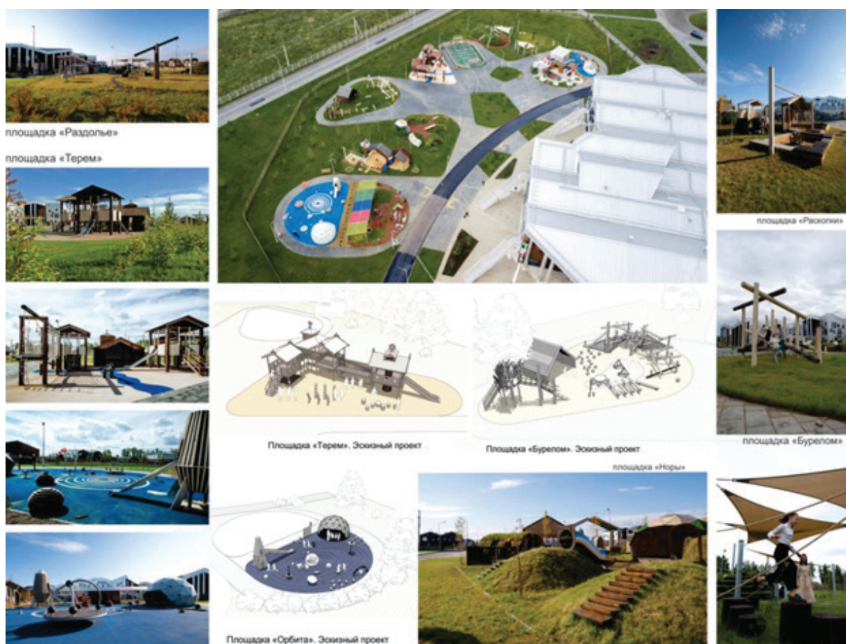
Рисунок 3 – Игровые площадки в образовательном комплексе «Точка будущего», г. Иркутск (Россия) [10]

Элементы приключенческой площадки можно встретить на площадке «Бурелом». Здесь хаотично разбросаны брёвна, из которых в меру своей фантазии можно выстраивать различные фигуры. По кругу площадки выстроен маршрут из бревенчатых препятствий, ведущий к комплексу с деревянными гнездами на возвышении.