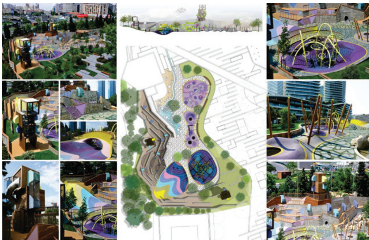
Рисунок 5 – Игровая зона в общественном Центре Zorlu, г. Стамбул (Турция) [12]

Благодаря разнообразной цветовой палитре и, несмотря на свои цвета и необычные формы, детская площадка прекрасно сливается с окружающим пейзажем, адаптируется под функцию игровой среды для детей и объединяет все объекты досуга (рисунок 5).