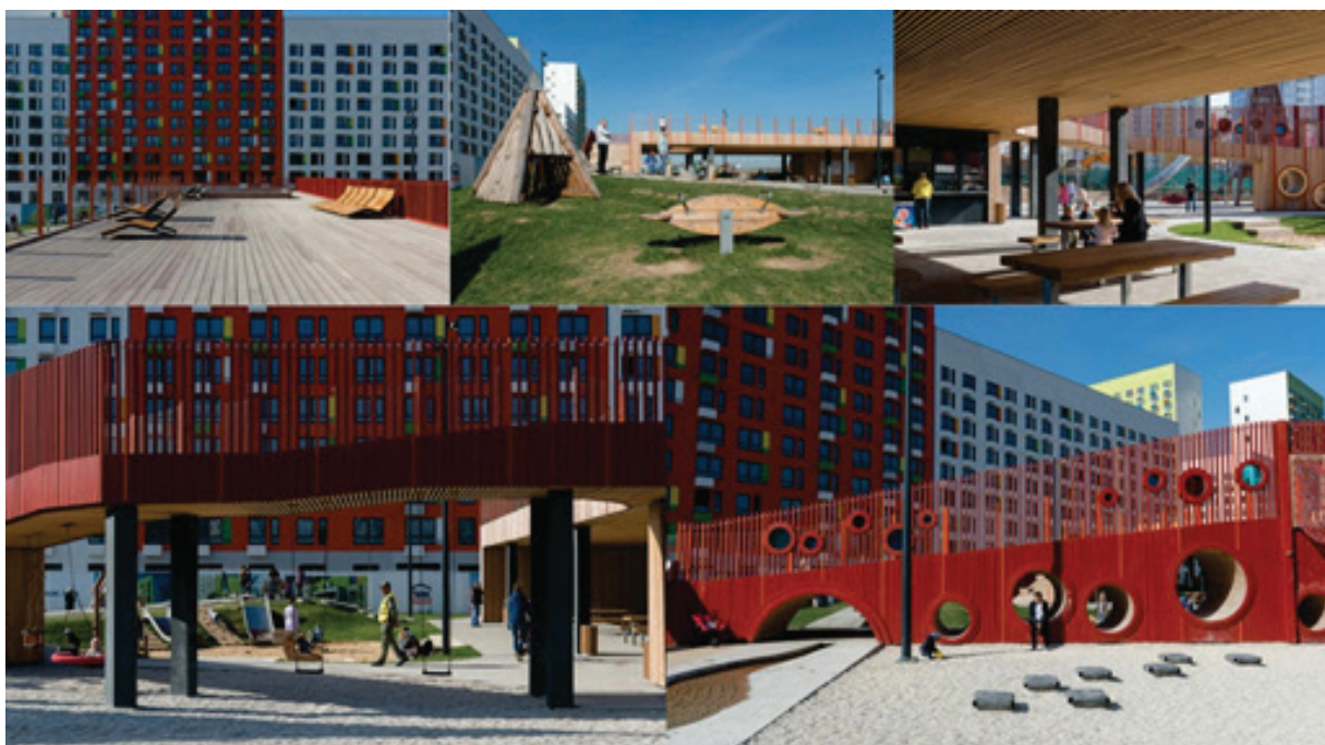
Рисунок 2 – Детская игровая площадка «Пирамиды», г. Москва [9]