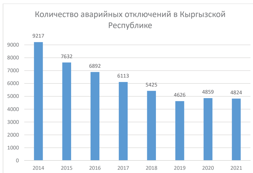
Рисунок 2 – Количество аварийных отключений в Кыргызской Республике [6]