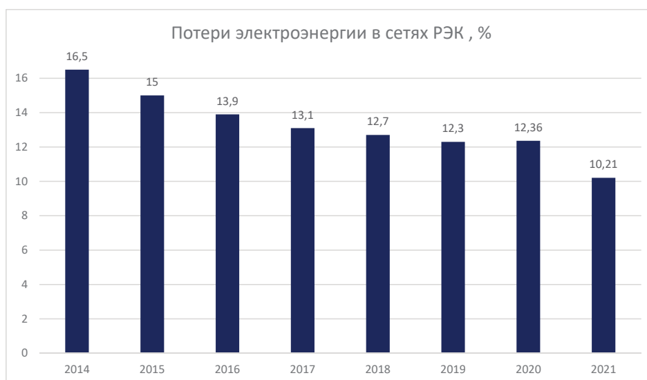
Рисунок 3 – Потери электроэнергии в сетях РЭК, % [6]

Потери электроэнергии в энергосистеме Кыргызской Республики составили: 2018 г. – 15,21 %, в 2019 г. – 15,28 %, в 2020 г. – 15,56 %, в 2021 г. – 14,35 % [12], за счет потерь в сетях НЭСК выше норматива (3–4 %).