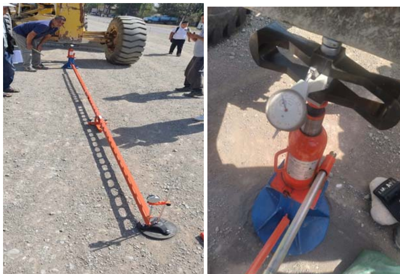
Рисунок 4 – Штамповые испытания конструкции дорожной одежды