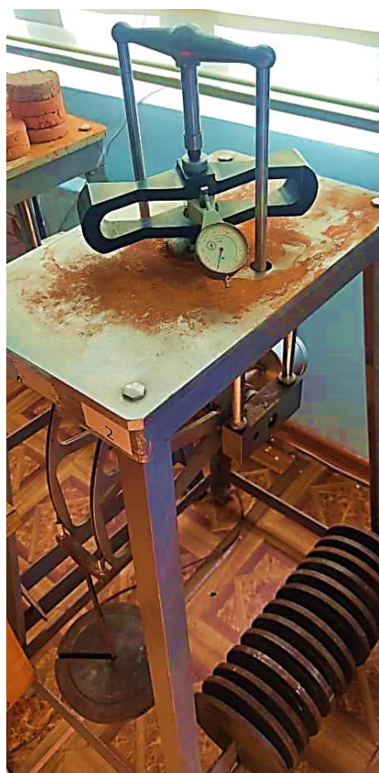
Рисунок 2 – Поверка на компрессионном приборе КПП-1