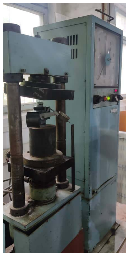
Рисунок 3 – Поверка ДОСМ-3-5 на гидравлическом прессе П-10