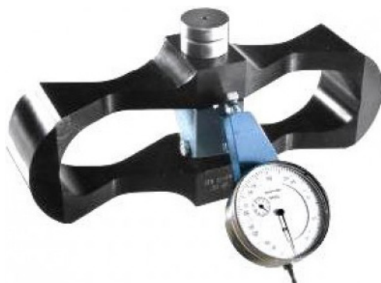
Рисунок 1 – Динамометр ДОСМ-3-5, 5 тс/50 кН

При подготовке к испытаниям штамп устанавливали на испытываемую поверхность после тщательного выравнивания ее россыпью тонкого слоя песка (1...5 мм) без нарушения структуры материала с тщательной притиркой или гипсовой кашицей толщиной в несколько миллиметров. Сжимающую нагрузку измеряли с помощью динамометра ДОСМ-3-5 (рисунок 1). Динамометр образцовый переносной серии ДОСМ (в дальнейшем – динамометр) предназначен для проверки испытательных рабочих средств измерений при статистических нагрузках. Динамометр ДОСМ внесен в Государственный реестр и утвержден к выпуску. Динамометры эталонные переносные ДОСМ предназначены для проверки рабочих средств измерений статических сжимающих усилий. Динамометры представляют собой упругое стальное цилиндрическое тело с механическим измерительным индикатором часового типа и переходными элементами – резьбовыми шпильками, соединенными с упругим элементом при подготовке к работе, и фиксируемые контргайками при нагрузке, превышающей наибольший предел измерения на 10 %.