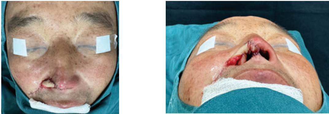
Рисунок 1 – Дефект кончика носа закрыт носогубным лоскутом (вид сразу после операции)