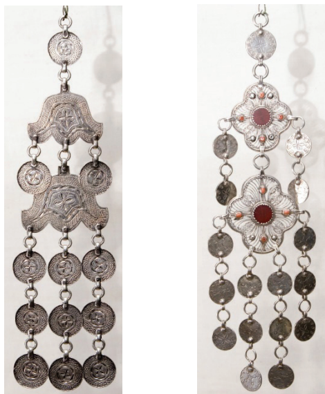
Рисунок 5 – Чолту (а). КП 3540-275 КНМИИ им. Г. Айтиева; Чолту (б). КП 7625-2100 КНМИИ им. Г. Айтиева