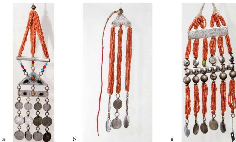
Рисунок 6 – Чач учтук (а). КП 5818-995 КНМИИ им. Г. Айтиева; Чач учтук (б). КП 7404-2003 КНМИИ им. Г. Айтиева; Чач учтук (в). КП 8706-2326 КНМИИ им. Г. Айтиева