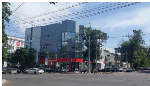
Рисунок 10 – Бишкекский центральный офис «Оптима банка», ул. Киевская, 104