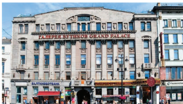
Рисунок 5 – Сибирский торговый банк