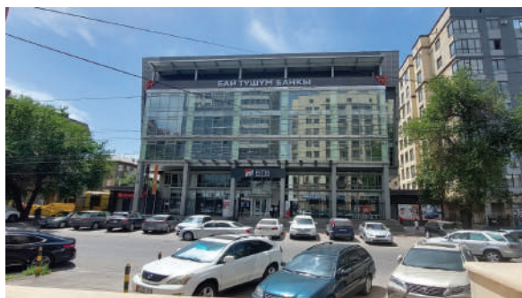
Рисунок 9 – Головной офис «Бай-Тушум», ул. Уметалиева 76, г. Бишкек