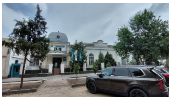
Рисунок 8 – Здание первого банка. Проспект Эркиндик, 59, г. Бишкек

Архитектура его была достаточно строга, лаконична, характерна стилю того времени, отдаленно напоминающая модерн. Ныне он реставрирован под новый банк (рисунок 8).