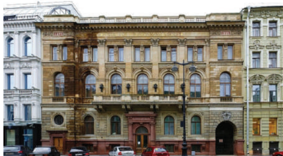
Рисунок 6 – Русский банк для внешней торговли