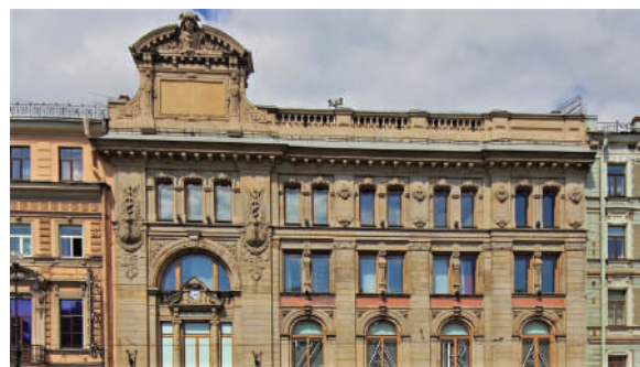
Рисунок 4 – Азовский коммерческий банк – Русско-Азиатский банк

Фасад с большими окнами-витринами был облицован красным гранитом, его украшали увенчанные статуями колонны. После революции здесь располагались книжный склад, универмаг, ателье. Сегодня в этом здании находится Генеральное консульство Франции в Санкт-Петербурге [4].