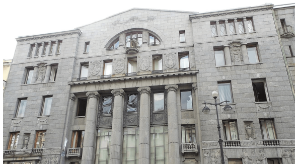
Рисунок 1 – Азовско-Донской коммерческий банк

Коммерческий банк «И.В. Юнкер и Ко» на Невском проспекте первоначально был конторой компании «Зингер», а в 1911 г. его выкупила компания «И.В. Юнкер и Ко» (рисунок 3). Здание было перестроено по проекту архитектора Вильгельм Ван дер Гюхта при участии Адольфа Эрихсона [4].