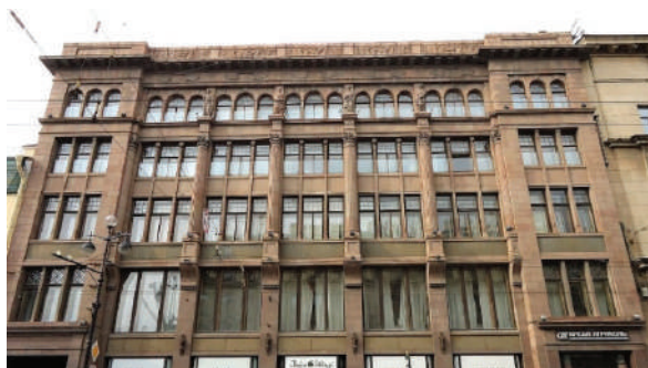
Рисунок 3 – Коммерческий банк «И.В. Юнкер и Ко»